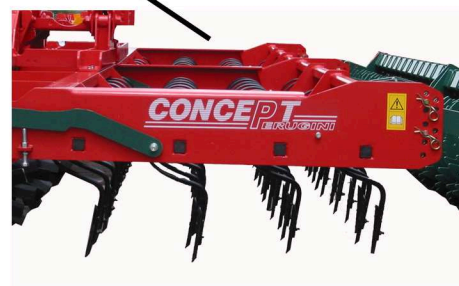
Four rows of heavy duty spring tines Molle disposte su quattro file