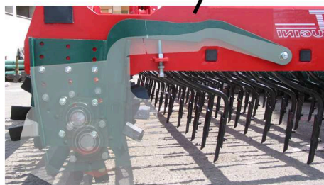
4 positions adjustable front rotor Rotore regolabile su 4 posizioni