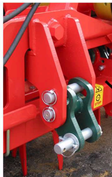
Floating tractor linkage Attacchi trattore flottanti

In rullo può essere usato in posizione flottante o rigida